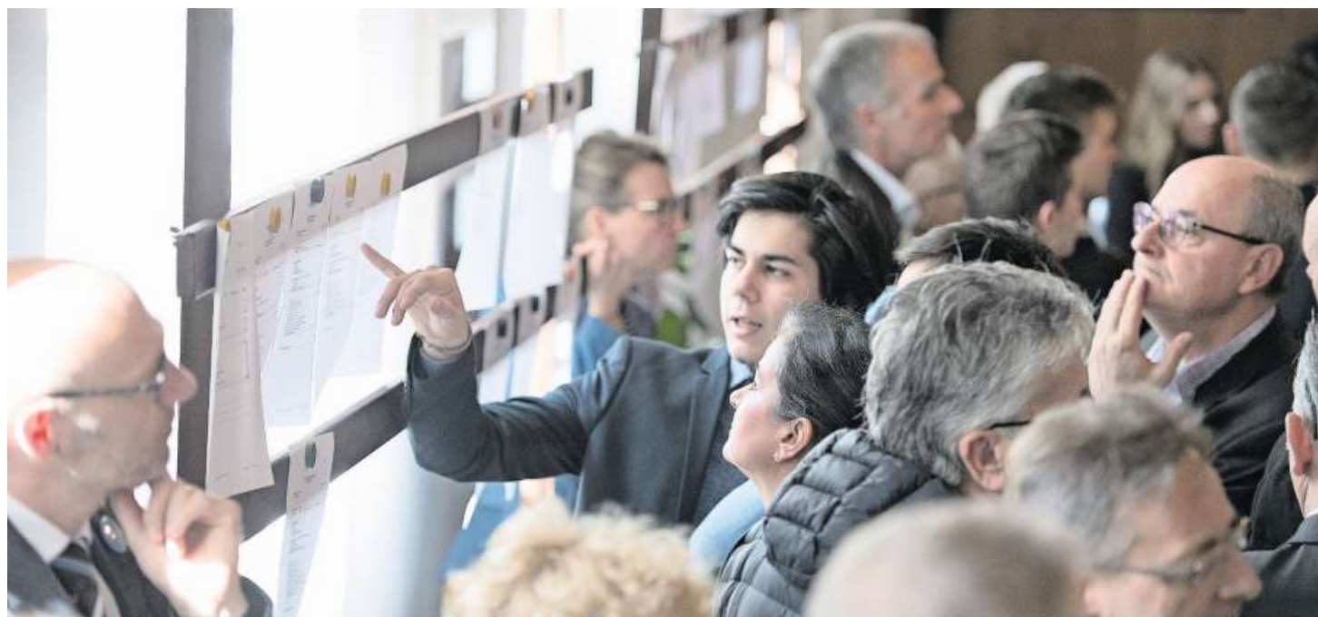
Besucher zeigen im Rathaus grosses Interesse an den Wahlergebnissen.

Federn lassen musste auch die CVP, die einen Sitzverlust zu verbuchen hat. «Unser Ziel, 17 Sitze zu halten, haben wir nicht erreicht. Uns war bewusst, dass dies nicht einfach zu erreichen