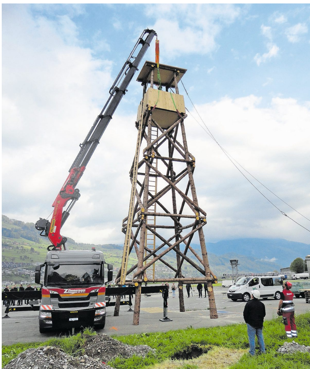
Der Hochsitz wird aufgerichtet.

Björn Britschgi dankte speziell dem Flugplatz Buochs und der Korporation Buochs für die Nutzung des Areals. Das Abschätzen des Ausstellungsablaufs sei eine der grössten Herausfor-